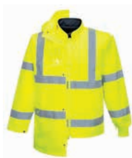
äußere Jacke mit Innenjacke