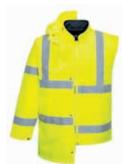
äußere Jacke mit ärmelloser Innenjacke