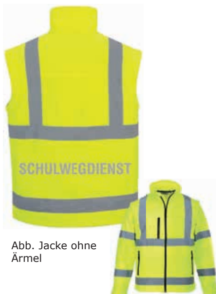
Abb. Jacke ohne Ärmel