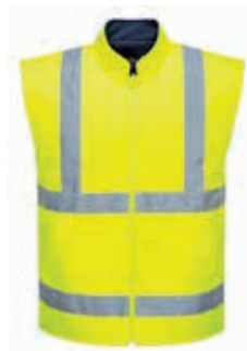
Innenjacke ohne Ärmel