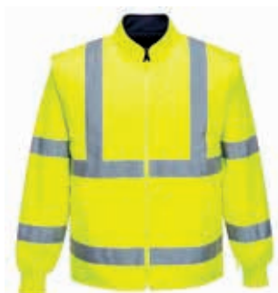
Innenjacke mit Ärmeln